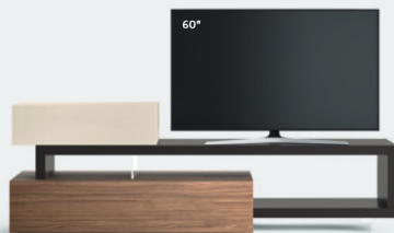
Lampo Sp60 35 L / W 2400 x H 755 x P / D 450 / 546. TV max 65" Noce • Canapa • Terranova Lucido