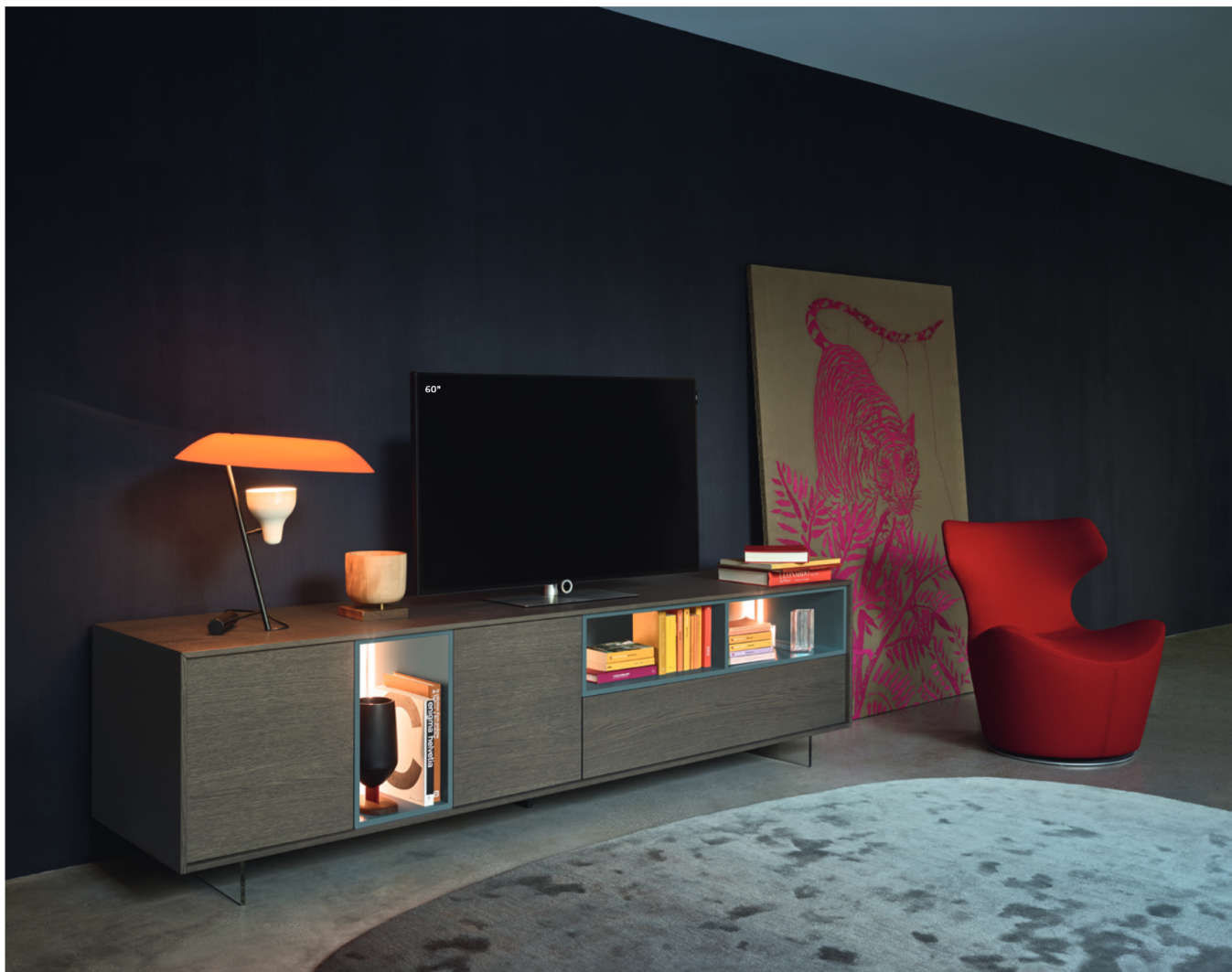
Lampo Open con riquadro 41 L / W 2430 x H 630 x P / D 465

Questa composizione Lampo Open in Rovere Grigio e Pervinca opaco è un gioco di luci, vuoti e pieni racchiusi entro un perimetro e sospesi da terra, con un effetto al tempo stesso rassicurante e dinamico. Con piedi in metacrilato H 120