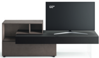
Lampo Open 3 L / W 2100 x H 735 x P / D 354 / 546