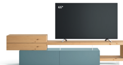
Lampo Sp60 33 L / W 2700 x H 655 x P / D 450 / 546. TV max 70" Nodato Naturale • Pervinca