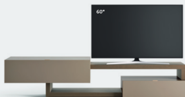
Lampo Sp60 40 L / W 2650 x H 560 x P / D 450 / 546 Rovere Argilla • Ombra