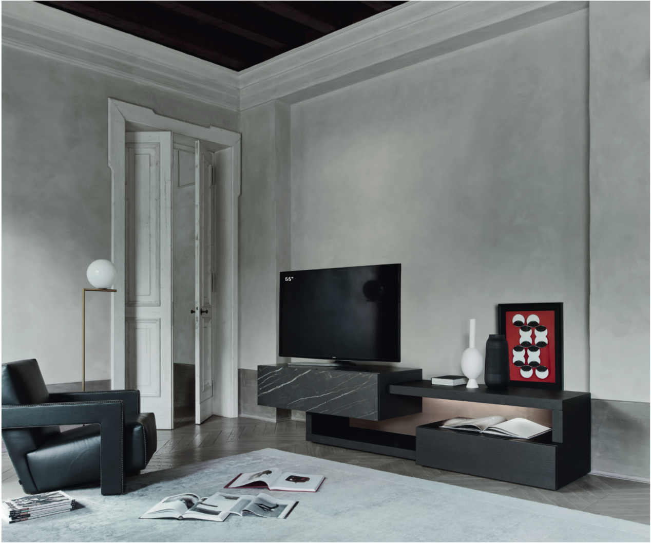
Lampo Sp60 38 L / W 2400 x H 560 x P / D 450 / 546 TV max 60"

Effetti tridimensionali di vuoti e di pieni, intersezioni di superfici e volumi, trattati con l'eleganza chic del Rovere Carbone e con l'estetica senza tempo della ceramica Noir Desir.