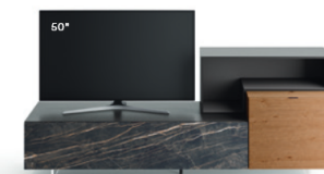
Lampo Open 8 L / W 1950 x H 800 x P / D 354 / 450 Nodato Caramello • Brown • Ceramica Noir Desir • piedi metacrilato / methacrylate feet H 120

The Open TV Unit elements have a slimmer thickness than the elements with doors, and the open compartments can face in different directions, enriching the composition with unique geometries. In the picture, a composition in Loto Natura and Rovere nodato naturale, and an open wall unit in matt Pervinca finish, all on H 120 methacrylate feet.