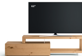
Lampo Sp60 26 L / W 2100 x H 515 x P / D 450 / 546 Nodato Naturale

This modular project with its wide range of finishes offers absolute freedom to create all kinds of different combinations to suit the space available and personal tastes. Recommended and maximum dimensions for the TV set are specified for each element.