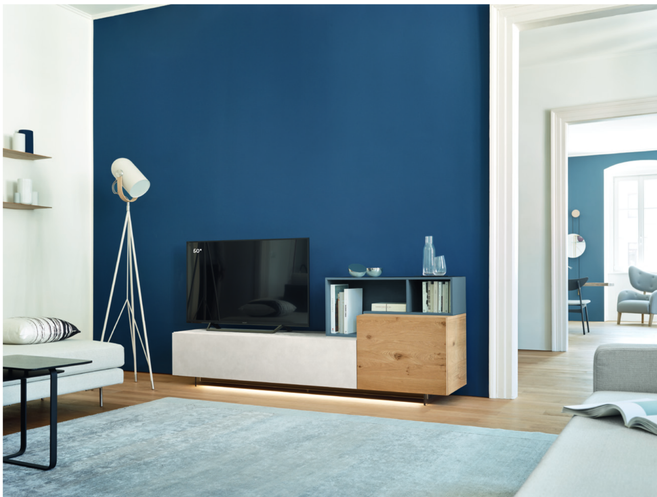
Lampo Open 9 L / W 2100 x H 800 x P / D 354 / 450

Gli elementi TV Units Open presentano spessori più sottili rispetto agli elementi con ante e possono disporre i vani a giorno in diverse direzioni, arricchendo la composizione con inedite geometrie d'uso. Nell'immagine, composizione in Loto Natura, Rovere nodato naturale e elemento a giorno Pervinca opaco, tutto su piedi in metacrilato H 120.