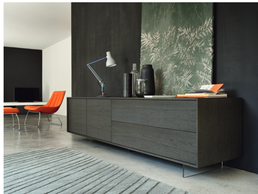
Lampo Basic 16 sx con riquadro L / W 2430 x H 630 x P / D 465 Rovere Grigio • piedi metacrilato / methacrylate feet H 120