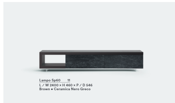
Lampo Sp60 11 L / W 2400 x H 460 x P / D 546 Brown • Ceramica Nero Greco