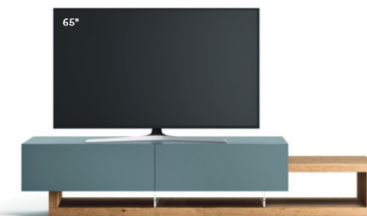
Lampo Sp60 29 L / W 2400 x H 515 x P / D 450 / 546. TV max 70" Nodato Naturale • Pervinca