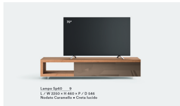
Lampo Sp60 9 L / W 2250 x H 460 x P / D 546 Nodato Caramello • Creta lucido