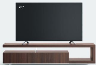
Lampo Sp60 14 L / W 2100 x H 500 x P / D 456 Rovere Termotrattato

60-mm-thick panels form self-supporting structures that do not require wall anchoring; featuring various combinations of woods, lacquers and metal finishes, as well as ceramic front panels. Available with methacrylate feet to support and level the various elements and achieve a feeling of lightness.