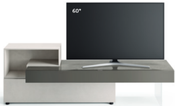
Lampo Open 4 L / W 2250 x H 735 x P / D 354 / 546. TV max 65"