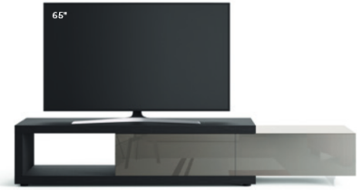
Lampo Sp60 5 L / W 2550 x H 460 x P / D 450. TV max 75" Rovere Carbone • Ardesia Lucido