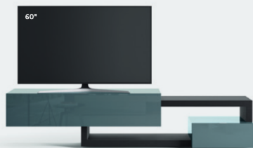
Lampo Sp60 39 L / W 2400 x H 560 x P / D 450 / 546. TV max 65" Rovere Carbone • Pervinca lucido