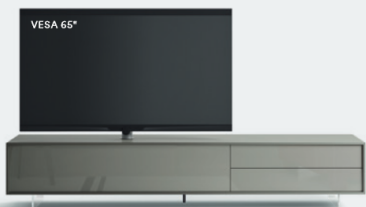
Lampo Basic 5 sx con riquadro L / W 2430 x H 470 x P / D 561 Ardesia • Ardesia lucido • piedi metacrilato / methacrylate feet H 120