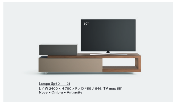
Lampo Sp60 21 L / W 2400 x H 700 x P / D 450 / 546. TV max 65" Noce • Ombra • Antracite