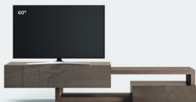
Lampo Sp60 41 L / W 2700 x H 560 x P / D 450 / 546. TV max 65" Rovere Argilla • Creta lucido

Nella stessa composizione, il gioco formale fra i vari elementi si può vestire con diversi colori e finiture, interpretando molteplici stili e personalità.