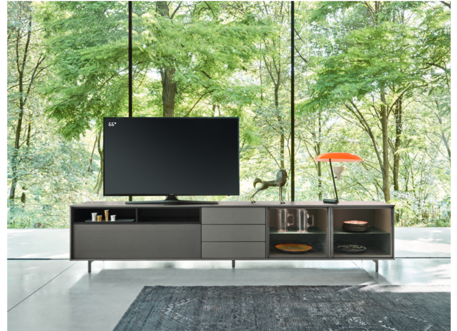
Scigno con riquadro 300 L / W 3015 x H 630 x P / D 561

Una soluzione d'arredo che unisce le funzioni di contenimento, esposizione e intrattenimento multimediale. L'elemento dotato di frontale microforato può essere attrezzato con altoparlanti. L'elemento è proposto interamente in finitura laccata metallo Piombo. Con piedi cilindrici H 120.