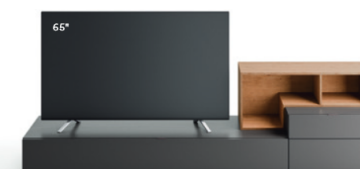
Lampo Open 11 L / W 2400 x H 655 x P / D 354 / 450. TV max 65" Nodato Caramello • Brown