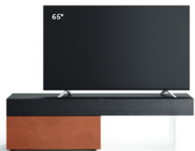
Lampo Basic 25 sx L / W 1800 x H 495 x P / D 546. TV max 75" Rovere Carbone • Rame