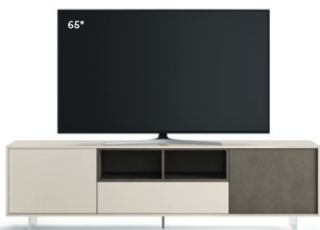
Lampo Open 39 L / W 2130 x H 630 x P / D 465