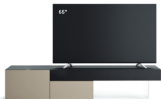
Lampo Basic 21 sx L / W 2100 x H 415 x P / D 546 Rovere Carbone • Ombrà