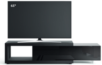
Lampo Sp60 2 L / W 2100 x H 460 x P / D 546 Rovere Carbone • Nero Lucido