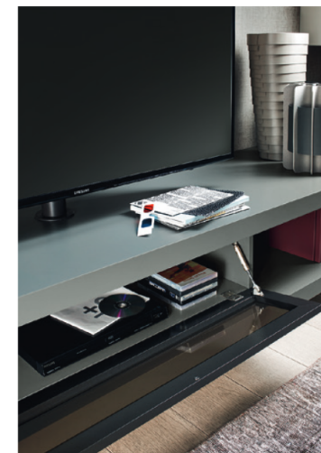
Base Sp60 CDG2708C sx tipo B L / W 2700 x H 480 x P / D 546 Vesa per TV 65"

Una delle molteplici combinazioni possibili per la base composta da piani di spessore 60 mm, abbinati a elementi a ribalta, cassettiere o elementi a giorno, in un libero gioco di linee e volumi. La composizione qui proposta è in finitura Ferro e Vinaccia e Grigio Corda opaco. Nell'elemento con supporto TV orientabile Vesa, il frontale a ribalta in Stopsol permette agli impianti interni di ricevere il segnale del telecomando.