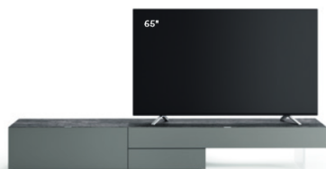
Lampo Basic 17 sx L / W 2400 x H 335 x P / D 546 Ferro • Top Pietra di Savoia