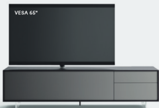
Lampo Basic 9 sx con riquadro L / W 2130 x H 550 x P / D 561 Rovere Carbone • Piombo • piedi metacrilato / methacrylate feet H 120