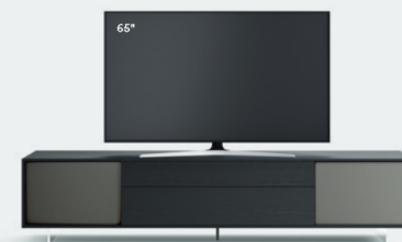
Incontro con riquadro 603 L / W 2430 x H 550 x P / D 561 Rovere Carbone • Piombo • piedi metacrilato / methacrylate feet H 120

Composizioni simmetriche o asimmetriche creano effetti diversi, attraverso il libero abbinamento di volumi, superfici e finiture, arricchite da un segno caratteristico: il riquadro che circonda i frontali come una cornice. A seconda della configurazione della base, la TV può essere semplicemente appoggiata oppure collocata sul supporto orientabile Vesa.