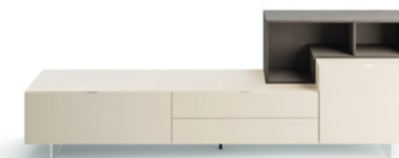
Lampo Open 10 L / W 2400 x H 800 x P / D 354 / 450. TV max 65" Canapa • Loto Terra • piedi in metacrilato / methacrylate feet H 120