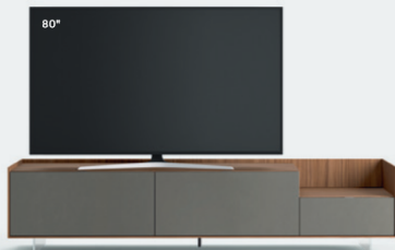
Cabaret 9D sx L / W 2420 x H 555 x P / D 570 – Step H 160 Noce • Piombo • piedi metacrilato / methacrylate feet H 120

An overview of Cabaret bases in various finishes, configurations and sizes, with a play of volumes in height achieved with a lowered 160 mm top, determining different display spaces: simply to hold the TV or to create a tray on which to place assorted objects.