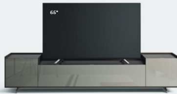
Cabaret 26G L / W 2420 x H 515 x P / D 570 - Step H 80 Brown • Ardesia lucido • piedi / feet Piombo