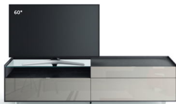
Cabaret 15B dx L / W 2420 x H 635 x P / D 570 – Teca H 160 Rovere Carbone • Grigio Corda Lucido • piedi metacrilato / methacrylate feet H 120

The TV can sit freely on the base, or in some combinations, the Vesa swivel TV stand can be attached. For each composition, the recommended and maximum screen sizes are specified.