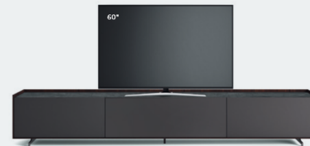
Cabaret 12A L / W 3020 x H 515 x P / D 570 Brown • Top Pietra Savoia • piedi / feet Brown

Fra le varie personalizzazioni, c'è la possibilità di attrezzare l'anta a ribalta anteriore con un frontale microforato che permette di gestire l'impianto all'interno con il telecomando, nascondendolo alla vista.