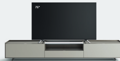
Cabaret 4C L / W 2720 x H 435 x P / D 570 – Teca H 160 Grigio Corda • Piombo • piedi / feet Piombo