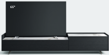
Cabaret 52G dx L / W 2420 x H 435 x P / D 570 - Step H 80 Rovere Carbone • Top Statuarietto • piedi / feet Piombo