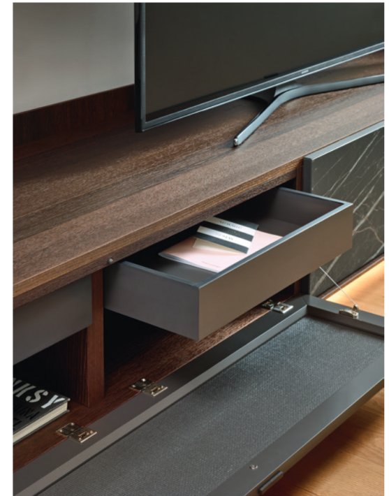
Base Cabaret Ceramica 3E L / W 2420 x H 515 x P / D 570

I frontali in Ceramica con effetto Noir Desir, in abbinamento alla finitura Rovere Termotrattato, rendono particolarmente suggestivo questo elemento d'arredo, conferendogli un particolare carattere estetico. Come si vede nell'immagine, alcune basi con ribalta possono essere dotate, su richiesta, di cassetti interni.