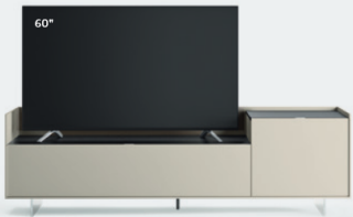
Cabaret 64D dx L / W 2120 x H 635 x P / D 570 – Step H 160 Grigio Corda • Top Nero Greco • piedi metacrilato / methacrylate feet H 120

Una panoramica di basi Cabaret in diverse finiture, configurazioni e dimensioni dove il gioco dei volumi in altezza è realizzato con un piano ribassato di 160 mm che determina spazi espositivi diversi: per appoggiare semplicemente la TV o per creare un vassoio su cui riporre vari oggetti.