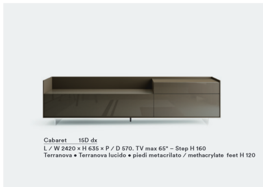
Cabaret 15D dx L / W 2420 x H 635 x P / D 570. TV max 65" – Step H 160 Terranova • Terranova lucido • piedi metacrilato / methacrylate feet H 120