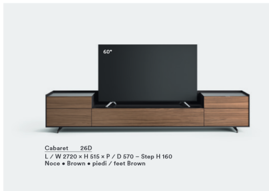
Cabaret 26D L / W 2720 x H 515 x P / D 570 – Step H 160 Noce • Brown • piedi / feet Brown