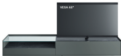
Cabaret 4B dx L / W 2720 x H 475 x P / D 570 – Teca H 160 Ferro • Top Nero Greco • piedi metacrilato / methacrylate feet H 120