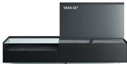
Cabaret 10B dx L / W 2720 x H 555 x P / D 570 – Teca H 160 Rovere Carbone • Top Nero Greco • piedi metacrilato / methacrylate feet H 120

La TV può essere collocata in appoggio sulla base, oppure alcune combinazioni prevedono la possibilità di inserire il supporto TV orientabile Vesa. Per ogni composizione viene riportata la dimensione di schermo consigliata e la dimensione massima utilizzabile.